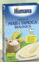
Crema di Mais e Tapioca Biologica