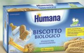
Humana Biscotto Biologico