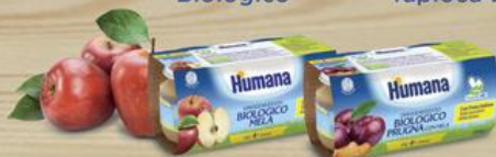
Omogeneizzato Biologico Frutta